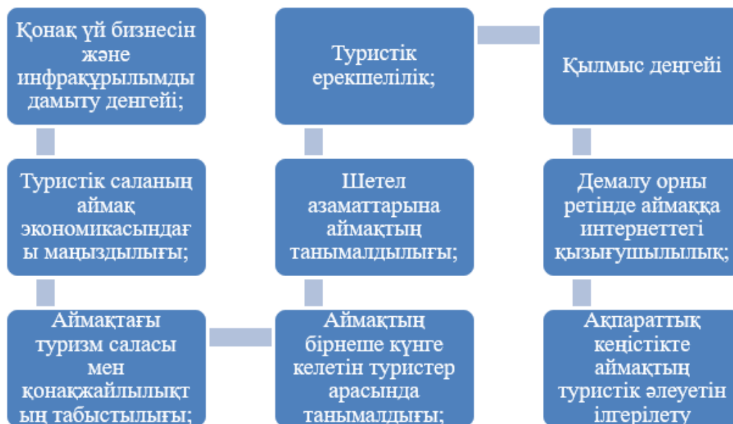
Сурет - 2 — Қазақстан Республикасының ұлттық туристік рейтингі

Осы әдістемелеге сәйкес, Қазақстан аймақтарының туристік секторының даму деңгейін, олардың туристік тартымдылығы мен туристік әлеуетін, отандық және шетелдік туристер арасындағы танымалдығын 9 фактор арқылы бағалау. (Сурет 2.)