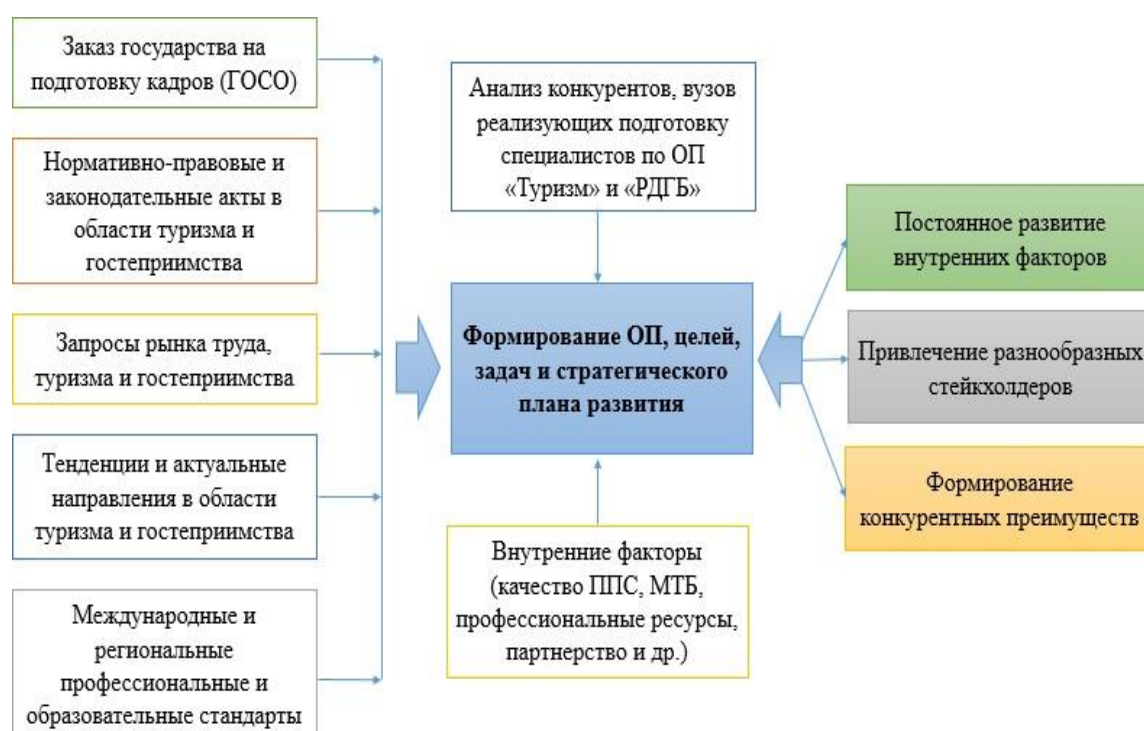
Рисунок 1 – Разработка цели и стратегии развития ОП на основании анализа внешних и внутренних факторов

НАО «Международный университет туризма и гостеприимства» (IUTH) ежегодно обновляет действующие образовательные программы, а также создают новые программы на основании анализа внешних и внутренних факторов осуществляющим с широким привлечением разнообразных стейкхолдеров (ассоциаций, представителей бизнес-среды, работодателей, профессорско-преподавательского состава, представителей студенчества, и др). Формирование целей и стратегии развития образовательных программ происходит при тщательном изучении запросов государства, требований бизнес-среды, запросов работодателей и т.д.