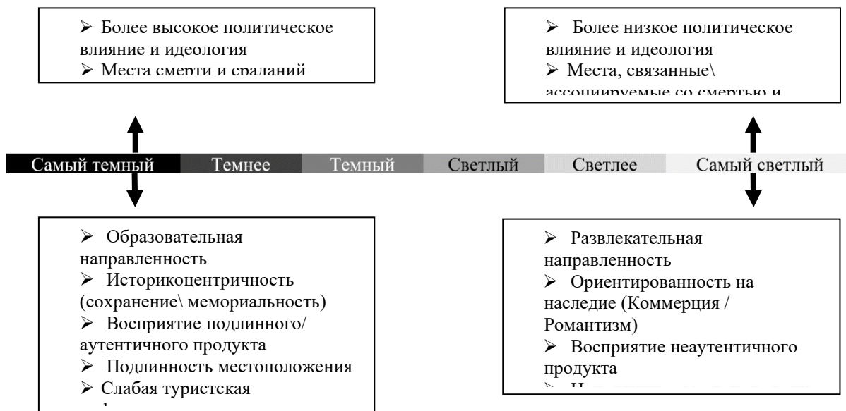
Рисунок 1 – Спектр темного туризма: воспринимаемые особенности продукта темного туризма. В рамках предложения «самый темный-светлый» [4, с.151]

Согласно концепции Стоуна, представленной на рисунке 1, теория спектра учитывает различные оттенки «темноты», то есть воспринимаемый уровень мрачности туристского продукта – от наиболее «светлых» до наиболее «темных» его форм. Оттенок конкретного продукта определяется преобладающими характеристиками, такими как образовательная или коммерческая направленность, пространственная близость к подлинному объекту или событию, а также степень политического и идеологического влияния. На основе совокупности этих признаков становится возможной типизация туристских объектов, хотя она носит достаточно условный и неформализованный характер [4, с. 152].