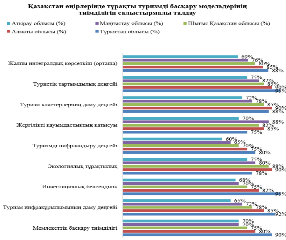
1 - Сурет – Қазақстан өңірлерінде тұрақты туризмді басқару модельдерінің тиімділігін салыстырмалы талдау

Төменде өңірлер бойынша тұрақты туризмді басқару модельдерінің салыстырмалы талдауы диаграммалық бағалау әдісіне негізделіп, пайыздық үлеспен ғылыми кесте түрінде берілді. Бұл пайыздар интегралдық бағалау (100%) принципімен, негізгі 5 индикаторға (басқару тиімділігі, инфрақұрылым, инвестиция, экологиялық тұрақтылық, цифрландыру) сүйене отырып есептелген(1-сурет).