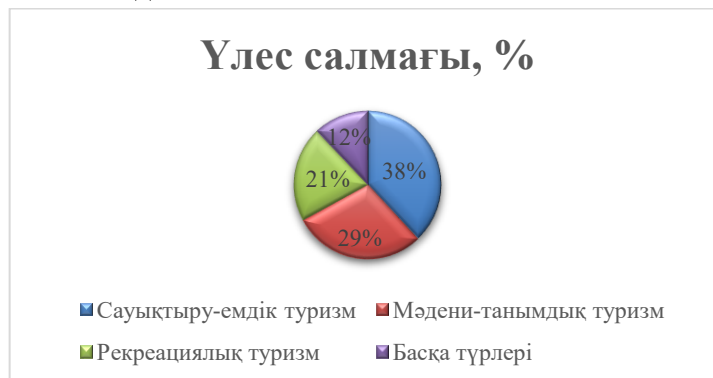
Сурет – 2 – Senior туристердің туристік сұраныс құрылымы

2-кестеде көрсетілген факторлар нарықтың дамуы көпөлшемді және жүйелік сипатқа ие екенін дәлелдейді. Бұл сегментті тиімді дамыту үшін туристік саясат демографиялық үрдістерді ескерумен қатар, экономикалық ынталандыру, әлеуметтік қолдау, технологиялық бейімдеу және инфрақұрылымды жаңғырту шараларын кешенді түрде жүзеге асыруды талап ететіндіктен, ғылыми зерттеулер мен практикалық туризмді басқару үшін стратегиялық маңызы бар бағыт болып табылады.