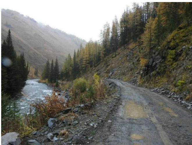
Ескі Австриялық жол

Зерттеу нысаны. Зерттеу нысаны ретінде Қатон-Қарағай ұлттық паркінің туристік инфрақұрылым элементтері мен жаяу қолжетімділікке әсер ететін кеңістіктік факторлар алынды. Нысан құрамына туристік соқпақтар, демалыс орандары, ақпараттық белгілер мен рельеф сипаттамалары алынды. Зерттеу барысы Қатон-Қарағай ұлттық паркінің ірі төрт туристік нысан бойынша жүргізілді: Рахман қайнары, Берел қорғаны, Язевое көлі, Ескі-Австриялық жол (1-сурет). Зерттеу территориясының табиғи-ландшафттық ерекшеліктері, яғни таулы рельеф, орманды аймақ, ерекше қорғалатын аумақтарға жататыны бағалау кезеңінде ескерілді. Зерттеу нысанының кең ауданды қамту және далалық бақылау ұзақтығының шектеулі болуы себебінен тек ірі 4 нысан талдауға алынды.