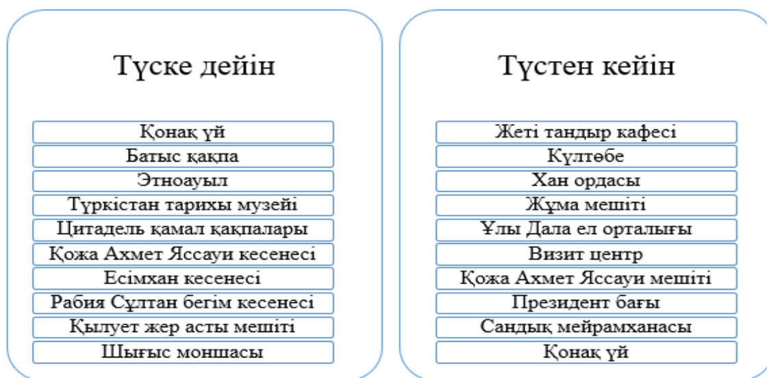
2-сурет – Екінші күннің экскурсиялық маршруты

Екінші күннің маршруты келесідегідей болады.