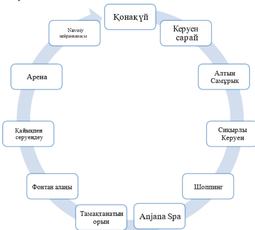
3-сурет – Үшінші күннің экскурсиялық маршруты

Қаланың қалған объектілеріне құрылатын маршрут демалу, сергіту, көңіл көтеру бағытында ұйымдастырылады.