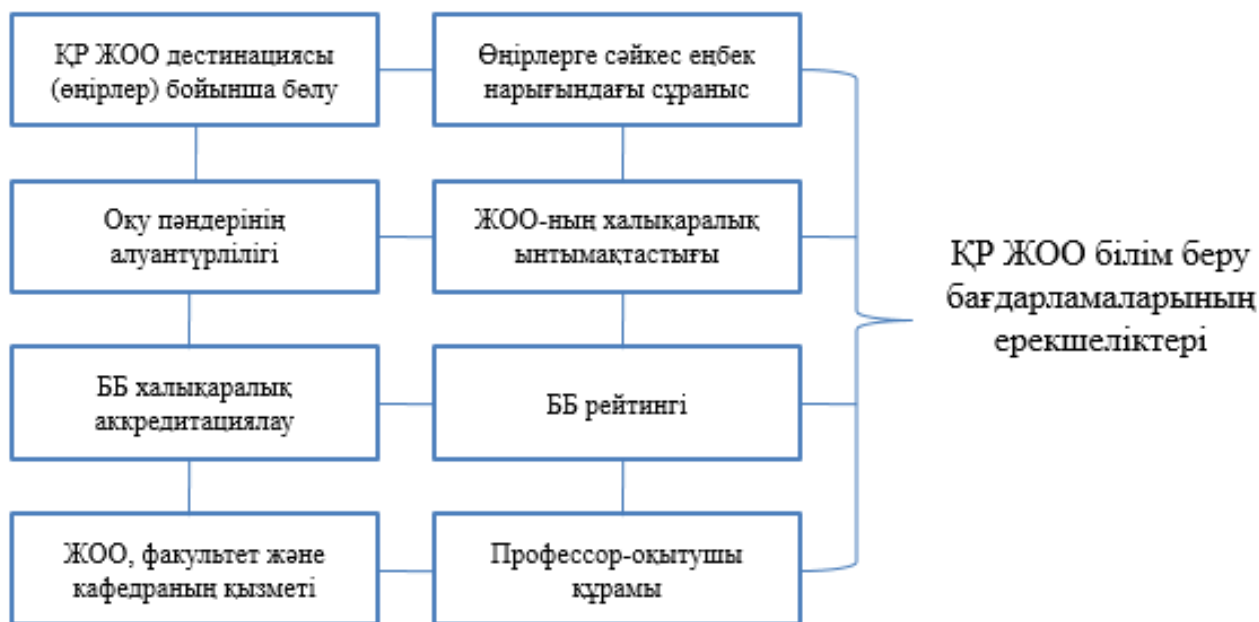
2-сурет – Қазақстан Республикасы жоғарғы оқу орындарының білім беру бағдарламаларының негізгі ерекшеліктері

Қазіргі кезде Қазақстанның көшбасшы ЖОО-да білім беру бағдарламаларына жоғарыда айтылған негізгі бағыттырады белсенді енгізу барысында. Осы бағытта зерттеу жұмыстарын жүргізе отырып автор Туризм бойынша білім беру бағдарламаларына сараптама жүргізу барысында туристік кадрларды даярлау бойынша Қазақстанның жоғары оқу орындарының білім беру бағдарламаларының ерекшеліктері анықталды (2-сурет).