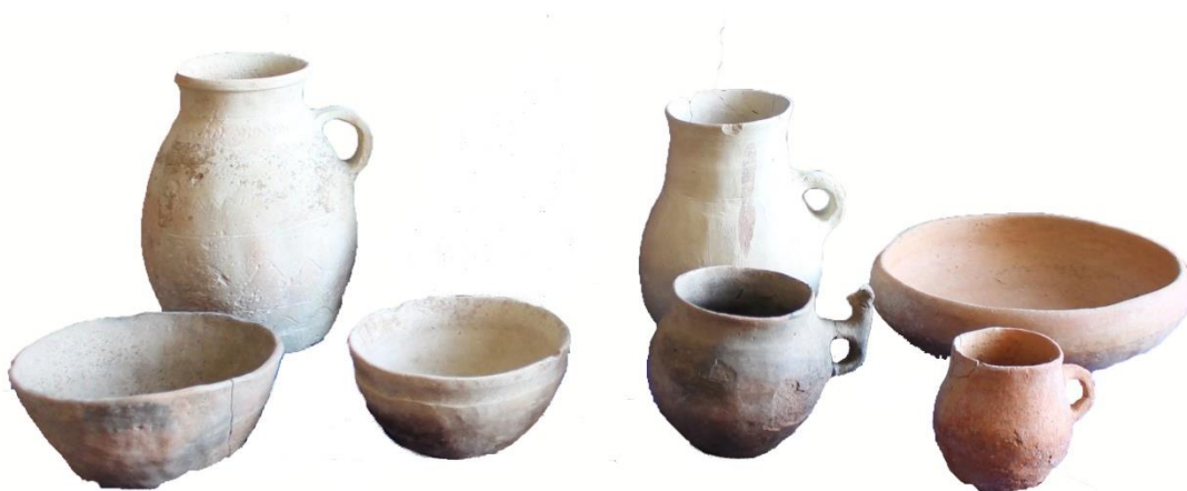
Сурет-3. №3 обадан табылған саз ыдыстар

Ғалымдар зооморф тұтқалы керамикалардың ең еретелерін б.з.б. 1 ғасырға жатқызған. Б.з.б. 1 мыңжылдықтың екінші жартысында Сырдарияның төменгі ағысында пайда болған, содан кейін Сырдарияның ортаңғы және жоғарғы ағыстарына тарала бастаған деген пікірлер бар. Л. М. Левина, Төмпақасар қаласынан табылған зооморф тұтқалы керамиканы б.з.б. 1 мыңжылдықтың екінші жартысына мерзімдеген [15, 517-518]. Сондықтан №3 обаны б.з.б. 1 – б.з. 1 ғасырына жатқызуға болады.