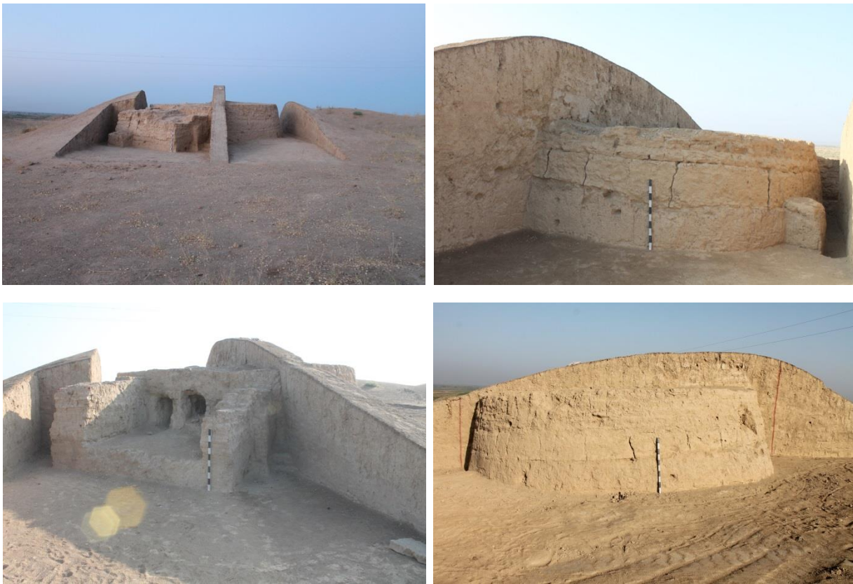
Сурет-3. Мыңтөбе қорымындағы сағанадан көрініс