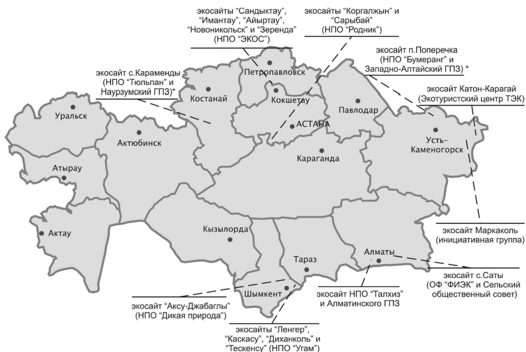
Сурет 2- ситуациялық жоспар-экосайттардың орналасу схемасы

Қазіргі уақытта Қазақстанда Ақмола, Алматы, Шығыс Қазақстан, Жамбыл, Солтүстік Қазақстан және Оңтүстік Қазақстан облыстарында 10-нан астам экосайт жұмыс істейді. Экосайт- бұл ЕОАҚ ұсынған термин және ауылдық қауымдастықтарға негізделген экотуризм дамитын және жобалар жүзеге асырылатын орынды білдіреді. Бұл эко-сайттардың көпшілігі ЕҚТА-да және оларға іргелес аумақтарда орналасқан. ЕҚТА - дан мыналарды атап өтуге болады: Ақсу-Жабағылы МТҚ, Алматы МТҚ, Қорғалжын МТҚ, Батыс Алтай МТҚ, "Көлсай көлдері" МҰТП, Катонқарағай МҰТП, Көкшетау МҰТП, Сайрам - Өгем МҰТП және т. б.